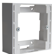
Boîtier de montage en surface: Ref 2210076